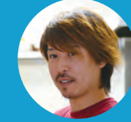
B 別棟2号店 ま マ

☎ 078-912-2738 11:30~14:30、 17:00~24:00 不定休