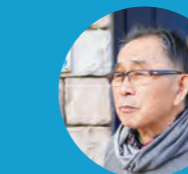
G 鉄板焼 舵 カヂ