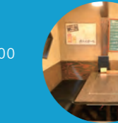
H 個室ダイニング N3 エヌスリー

☎ 078-911-3110 18:00~25:00、 日曜、祝日 18:00~24:00 無休