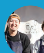
C TRATTORIA PIZZERIA CiRo チーロ

☎ 078-911-0735 (昼ごはん) 11:30~14:30、 (喫茶) 14:00~16:00、 (一品と呑み) 17:30~21:00 月、火曜休み