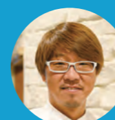
E お好み・鉄板焼き オハナ オハナ