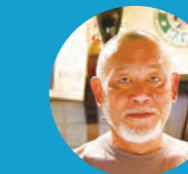
F LA COURONNE GOURMANDE ラ・クロンス・グルマン