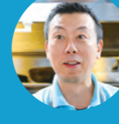
D 溶岩石焼 おかもと オカモト